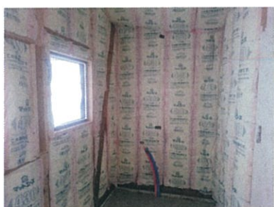
天井壁には高性能GW100,200mm