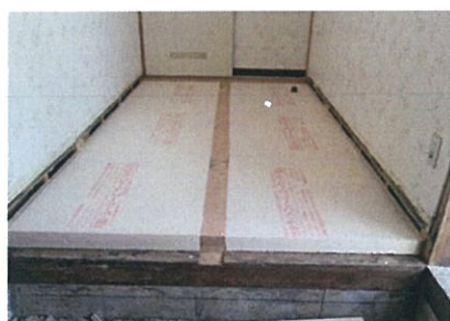
↑床にはスタイロフォーム100mm