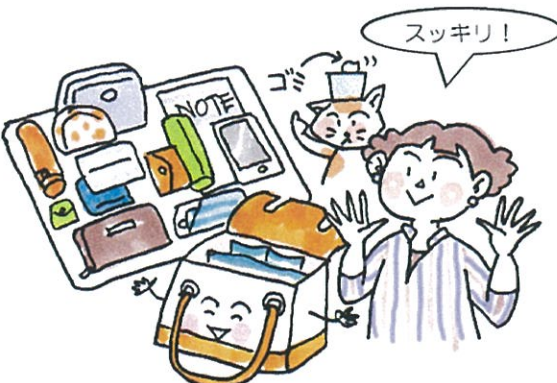
バッグの中と外側も軽くお掃除するといいわね!

持って行く目的や場所、服装に合わせて、取りかえることも多いバッグ。明日持っていきたい物が一目でわかるトレイで整理をすると、忘れ物防止にも役立ちそうですね！