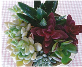
サボテン以外の多肉植物はレース越しの窓辺などに置いてあげましょう。直射日光に急に当てると、葉が焼けて色が悪くなる場合があります。