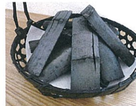
※写真のカゴは100円ショップで購入。黒く染めてみました。

インテリア用に焼かれた、長さのある竹炭を、壺やステンレスの傘立てなどに入れると、リビングのインテリアの主役になります。